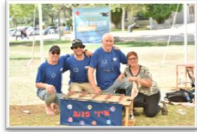
זכייה רביעית בתחרות 'טכנוראש' למשפחת הראל לכתבה המלאה