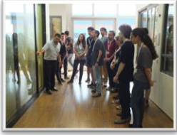
חשיפה לצפון: מחברים תיאוריה לפרקטיקה לכתבה המלאה